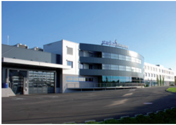
Das starlim//sterner Firmengebäude