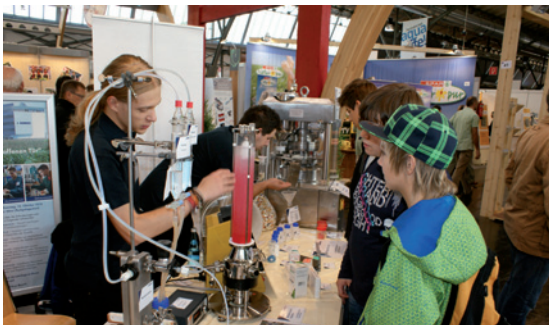
Lehrlinge präsentieren ihren Lehrberuf auf der Innsbrucker Herbstmesse