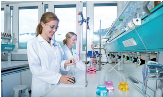
Chemielabortechniklehrlinge im Lehrlabor bei der Praxisausbildung