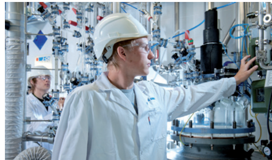
Chemieverfahrenstechniklehrlinge im Lehrtechnikum am Reaktor