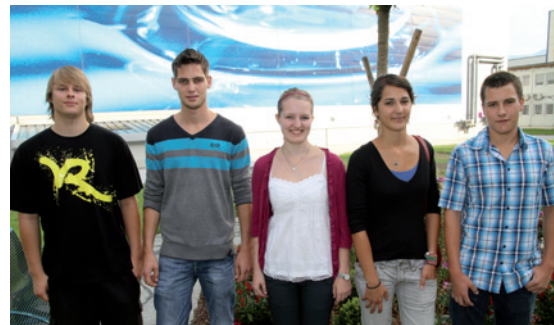
5 Landessieger beim Lehrlingswettbewerb 2011